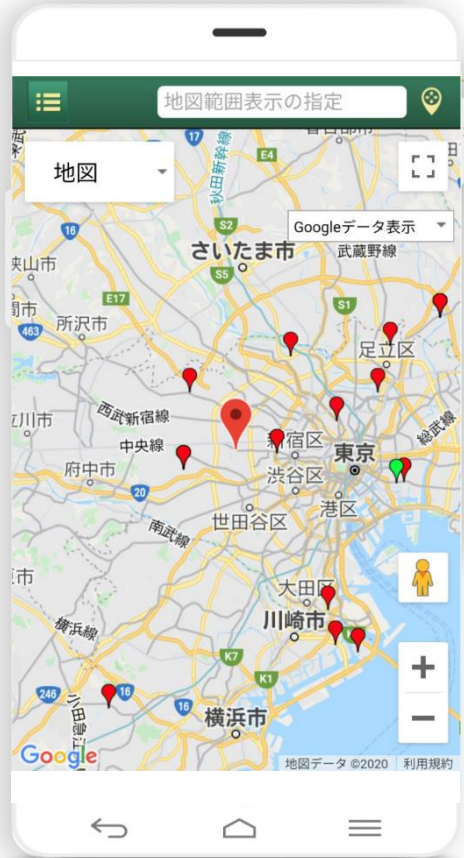
データをプロット